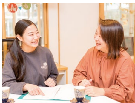
実習中も今も、気さくな園長先生の温かい人柄を支えられています。