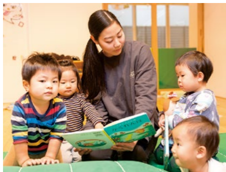
今は、まだまだだけど…気持ちを汲み取れる保育士になりたい。

生に相談したところ『無理に寝かそうとしてもいけないし、満足するまで遊んでもらおう』とアドバイスをもらい、近くに布団を置いて一緒に遊んでみました』すると間もなく…その乳児がスッと眠りについた。「無理に寝かしつけず、自然な入眠ができ『子どもの遊びたい気持ちを尊重できたのかな』とすごく嬉しかったです！その日の振り返りで、一緒に保育をしていた先生も『うまくいったね！』と一緒に喜んでくださって、喜びが2倍になりました」